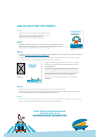
infofiche + beschrijfbare poster